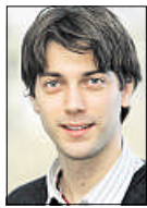
VON PHILIP SANDROCK