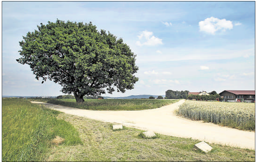
Streitpunkt vor Gericht: das bislang unbebaute Gewerbegebiet „Großer Forst“.

Das Gebiet „Großer Forst“ sei im Regionalplan, im Flächennutzungsplan und im inzwischen in Kraft getretenen Bebauungsplan als gewerbliche Baufläche ausgewiesen. Damit stehe die Nutzung als Gewerbegebiet nicht mehr zur Disposition. Außerdem verpflichte die Verbandsatzung