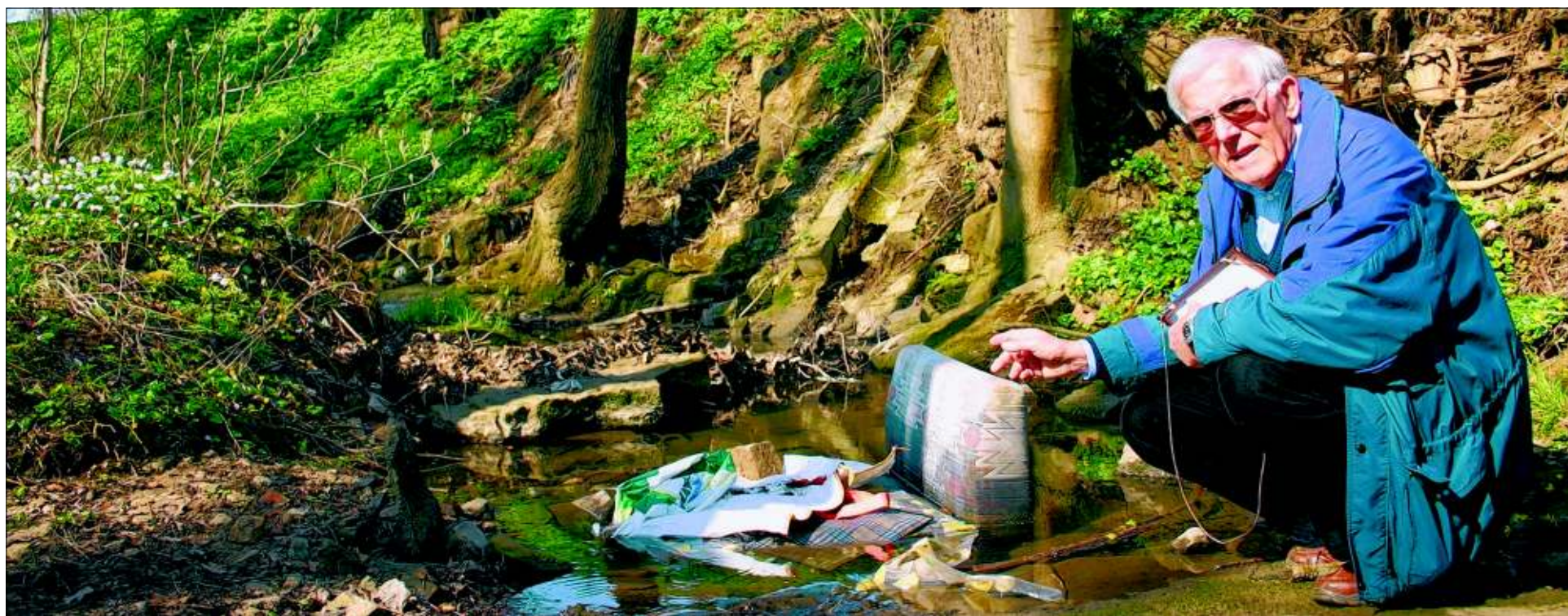
Der Erbgraben auf dem Fasanenhof ist ein geschütztes Biotop – und Müllabladeplatz. Darüber ärgert sich Kurt-Heinz Lessig, Hauptnaturschutzwart Nord beim Albverein.