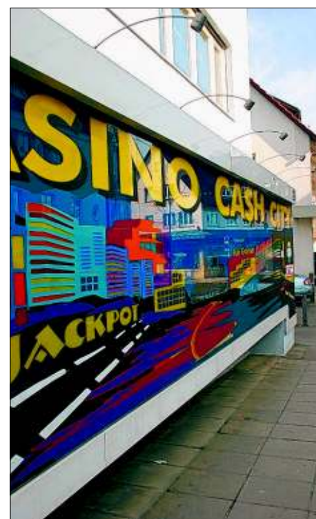
Geht es nach der Stadt, soll es in Möhringen keine weiteren Spielhallen geben.

Der Möhringer Bezirksbeirat hatte bereits im September 2008 einstimmig einen qualifizierten Bebauungsplan für die Ortsmitte gefordert. Damals war den Räten aber beschieden worden, dass das Verfahren zu aufwendig sei. Die Stadträte zeigten sich nun im „Großen und Ganzen“ einig, dass die Verwaltung „alles dafür tun soll, um weitere Spielhallen in Möhringen zu verhindern“, sagt ein Sitzungsteilnehmer.